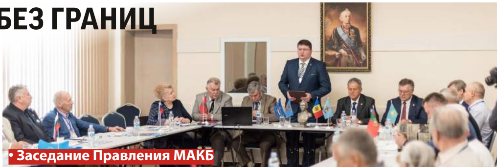
• Заседание Правления МАКБ