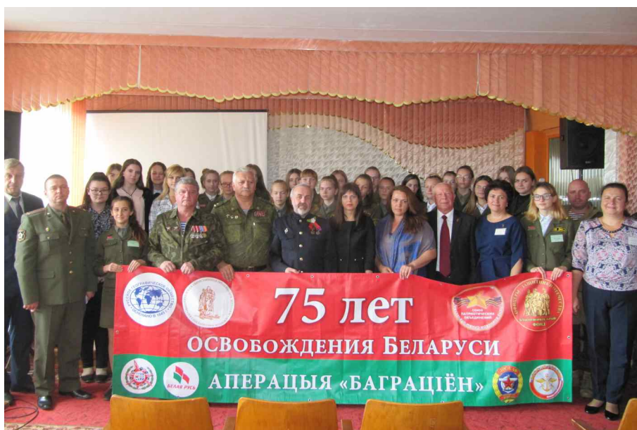
Средняя школа №6 города Калинковичи.

Самое активное участие в сопровождении автопробега приняли сотрудники ДОСААФ Республики Беларусь.