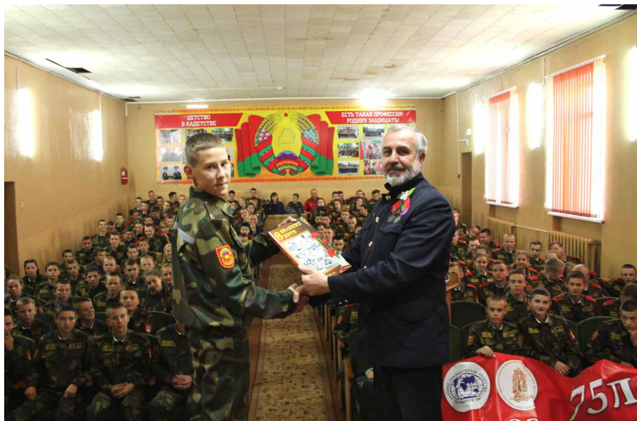
Брестское областное кадетское училище.