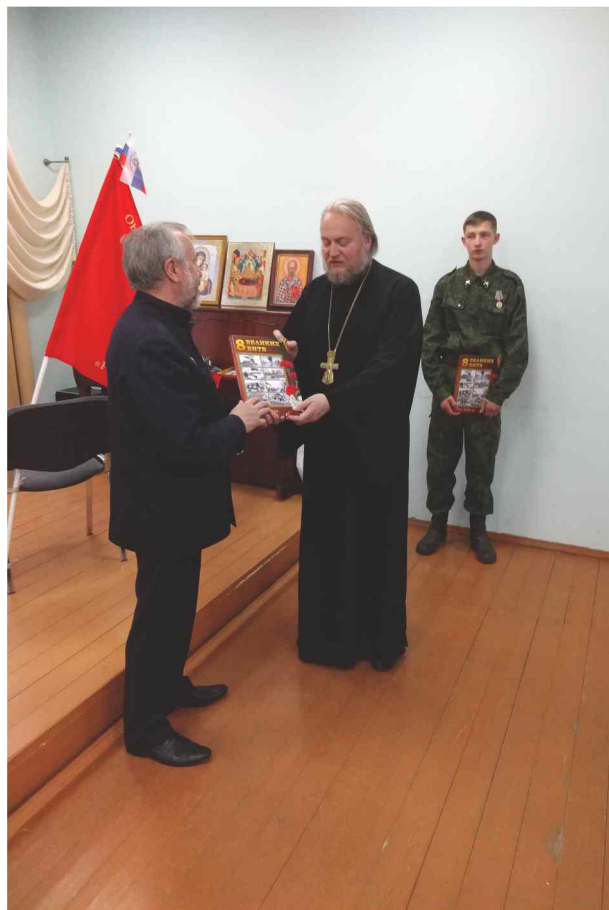
Презентация книги в духовно-просветительском центре «Успенский». Город Калуга.