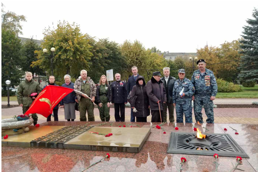
Возложение цветов у вечного огня города Калуги.

В ходе автопробега по Российской Федерации и Республике Беларусь было посещено 24 города и 3 посёлка.