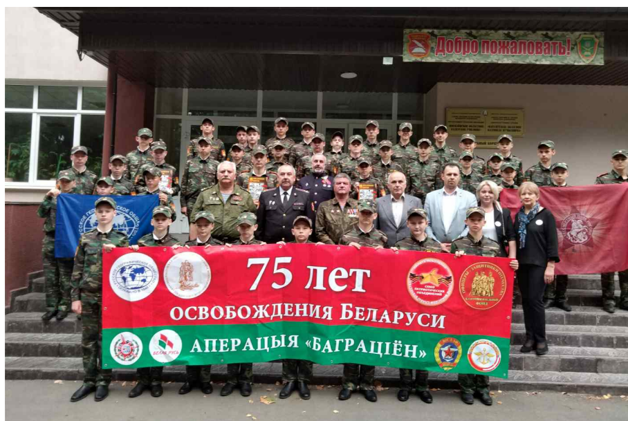
Встреча с воспитанниками Могилевского областного кадетского училища оставила самые теплые воспоминания у участников автопробега.