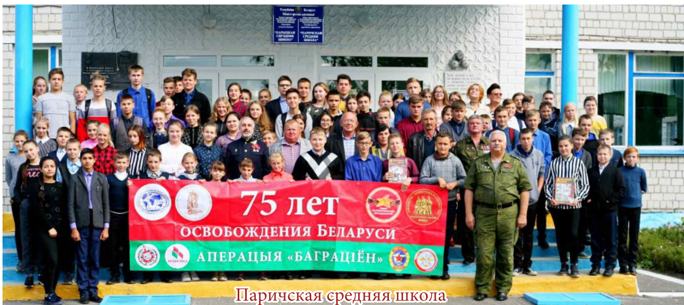
Паричская средняя школа

Немало потрудились советские инженеры и строительные батальоны, чтобы сделать болота проходимыми. Используя волокуши, построив плоты и возведя гати, войска 1-го Белорусского фронта преподнесли врагу убийственный сюрприз. Танки, артиллерия, пехота неожиданно для немцев прошли через казалось непроходимые болота и застали гитлеровцев врасплох, двумя главными ударами взяв в клещи немецкие армии группы «Центр».