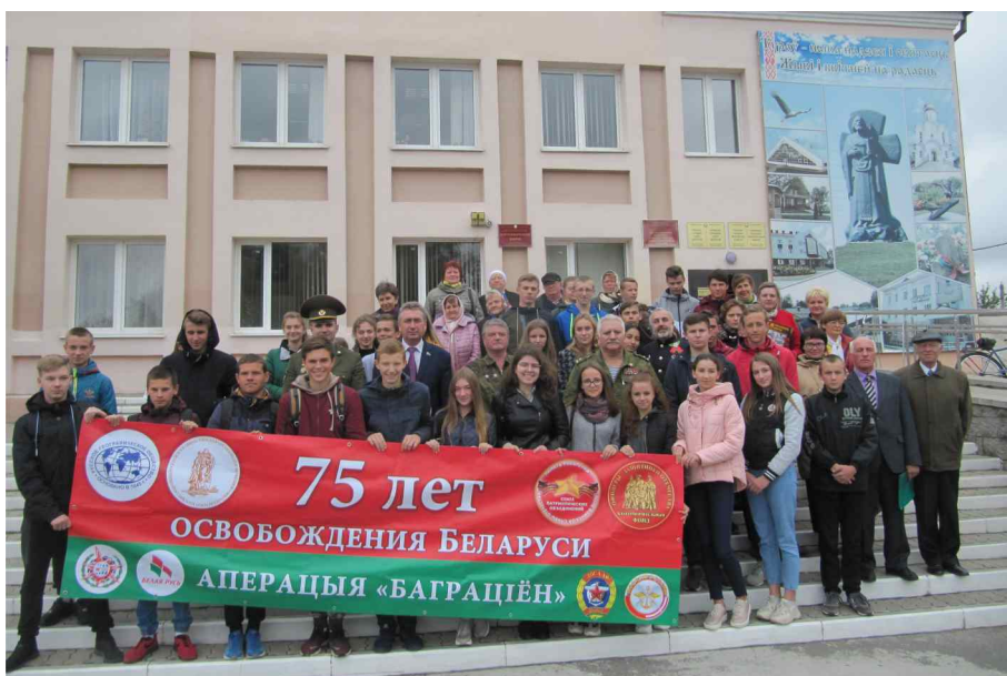
Центральная библиотека города Туров.