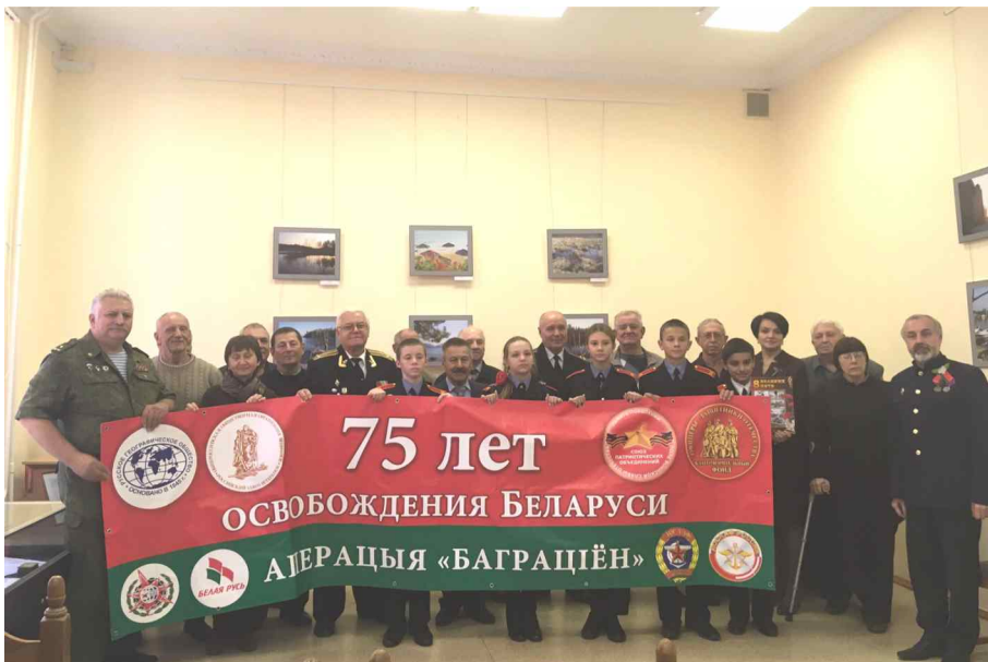
Презентация книги в центральной библиотеке города Брянска.