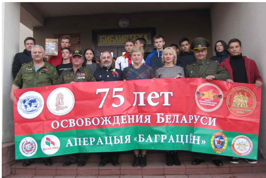
Центральная библиотека города Житковичи.