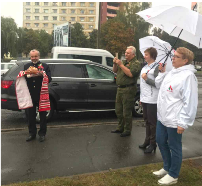
Традиционные хлеб-соль на земле Гомельщины.

Город Гомель был последним областным центром Беларуси, который советские войска оставили в 1941 году, и первым, который Красная Армия освободила от немцев 26 ноября 1943 года. В освобожденном Гомеле разместились руководящие партийные органы и наркоматы БССР. Поэтому с 31 декабря 1943 года по 15 июля 1944 года Гомель фактически являлся столицей республики.