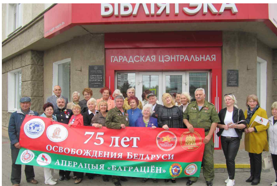
В городской библиотеке имени К. Маркса прошла встреча с представителями ветеранских и общественных организаций города.