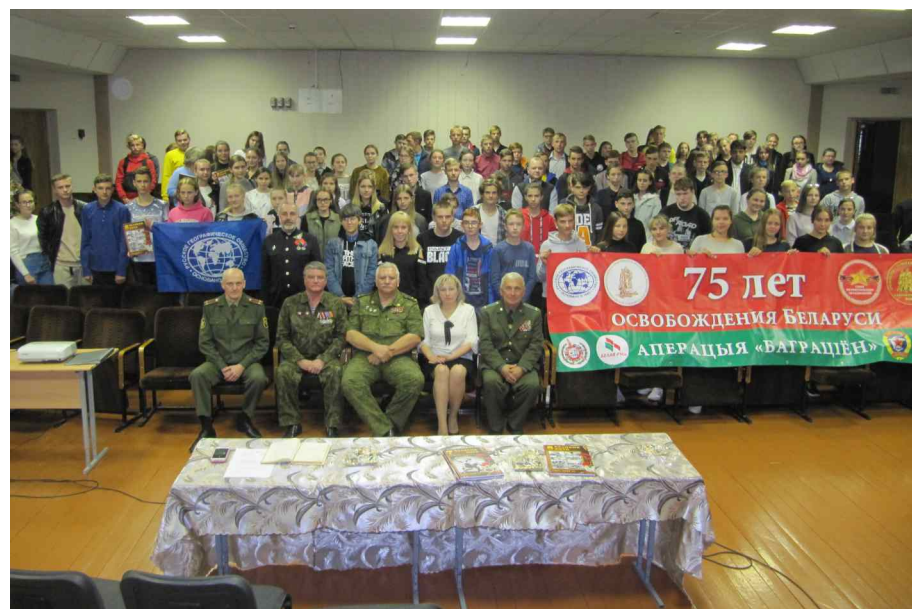
Встреча с учащимися лицея города Петрикова.