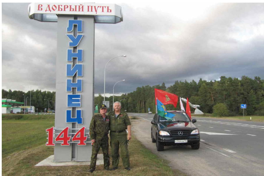
На въезде в город Лунинец.